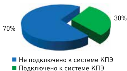
Рисунок. Статистика подключения к системе КПЭ

Главным администраторам средств федерального бюджета